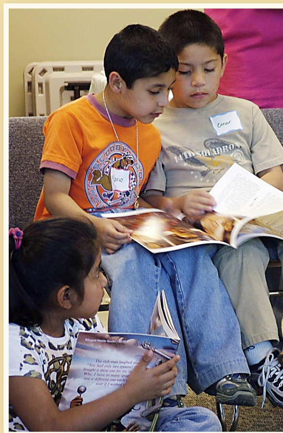
Niños participando en un programa PRIME TIME en el Condado de Fleming.

El programa fue desarrollado por el Louisiana Endowment for the Humanities y es llevado a cabo en 39 estados.