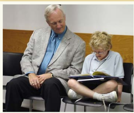
Wayne Onkst, izqui- erda, comisionado del Kentucky Department for Libraries and Archives, lee con un participante durante un evento de Prime Time en el Condado de Kenton.

PRIME TIME FAMILY READING TIME® es un programa de alfabetización intergeneracional que usa humanidades como herramienta para fomentar mayor interés en la lectura. A través de la combinación de laureados libros infantiles, temas humanísticos y conversación abierta, PRIME TIME conecta la literatura al mundo real de las familias participantes. PRIME TIME se enfoca en familias de pocos recursos y limitado nivel escolar, y con poco o ningún conocimiento del inglés. El objetivo del programa es la participación de padres y/o apoderados y sus niños de 6 a 10 años de edad quienes están a riesgo debido a sus pocas habilidades de lectura. También se proveen actividades de pre lectura para los hermanos más pequeños.