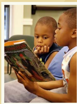
Niños leyendo durante un programa en el Condado de Nelson.

Todos los programas son gratis y abiertos al público.